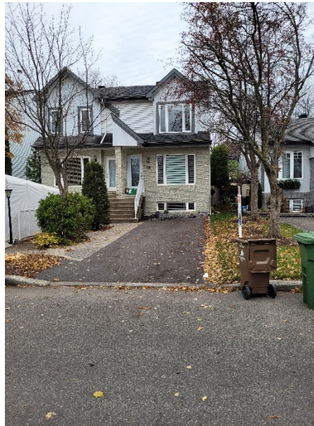
28, avenue des Laurentides (emplacement faisant l'objet de la demande)