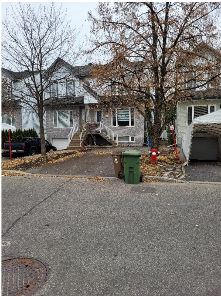
24, avenue des Laurentides (voisin de gauche)