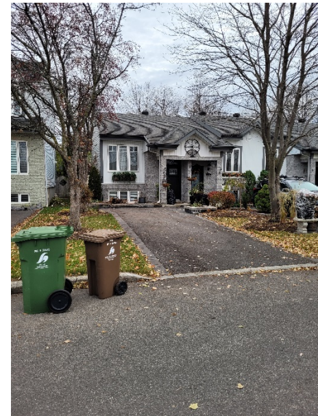
30, avenue des Laurentides (voisin de droite)